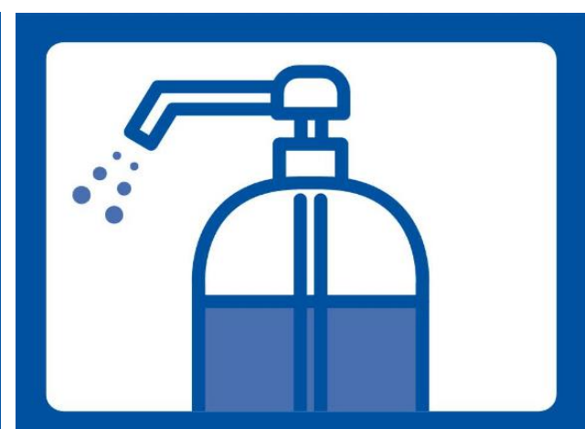
◇ 手指アルコール消毒