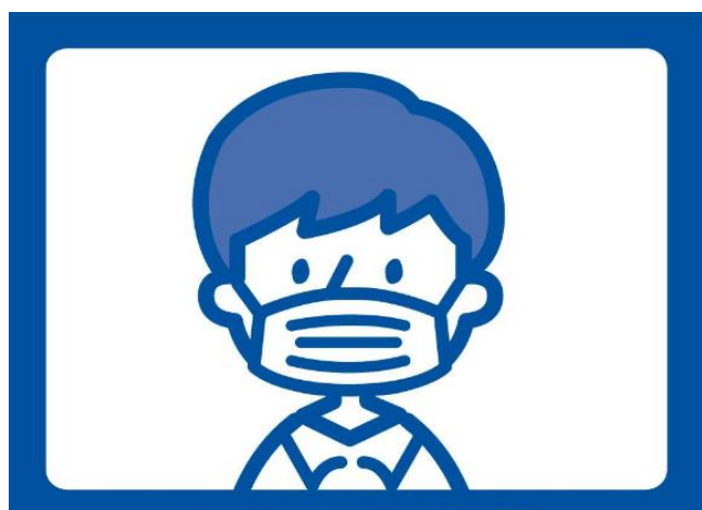
◇ 適正なマスク着用