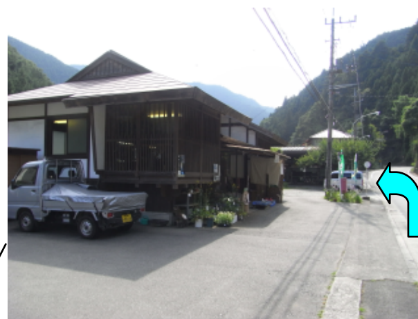
至: 都民の森・上野原