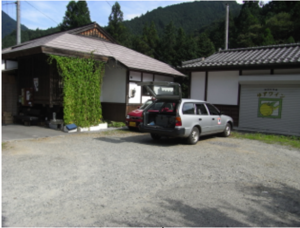
都民の森・上の原方面から見た砂利の駐車場